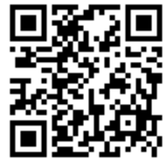
線上報名 QR Code