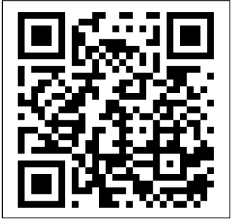
線上報名 QR Code

選課系統 key in A 班(多益班) (多益)_____分 B 班(多益班) (托福)_____分 C 班(托福、雅思班) (其他)_____分 D 班(亮點班)